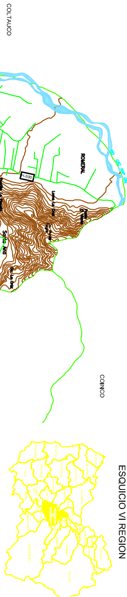
ESQUICHO VI REGION